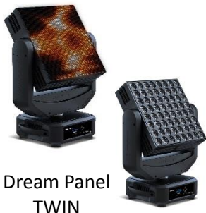
Dream Panel TWIN

さて、弊社ファーストエンジニアリングには続々と新製品が入荷してきました。Inter BEE にて大々的にお披露目の予定です。お楽しみに!!