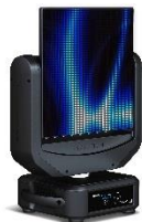
Dream Panel SHIFT

http://www.ayrton.eu/produit/dreampanel-twin/