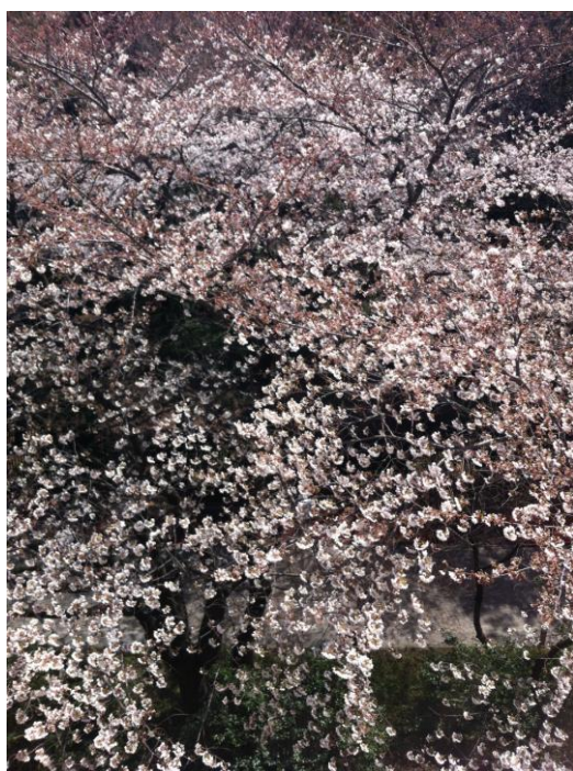
会場の桜は満開です。

会場では、AI サーバーや今年7月発売予定の Sapphire Touch など新製品も展示しました。