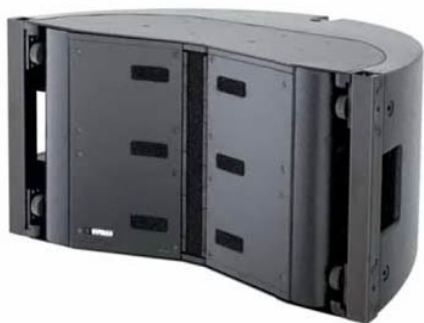
(写真)パワーアン プ内蔵のmini- COM.P.A.S.S

ファーストエンジニアリングでは、Outline製品のデモ機を各種取り揃えております。