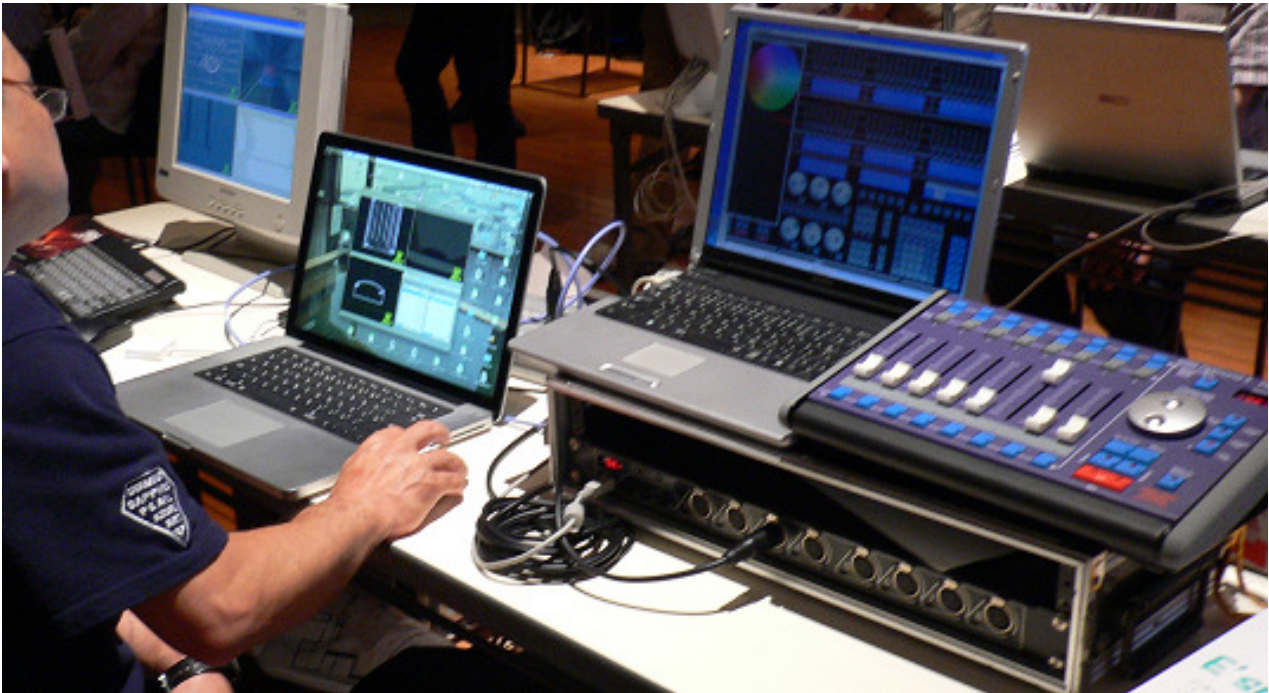
(写真)弊社の展示の様子。 Avolites D4 simulator, EZ DMX and D4 Pilot

2009年9月9日(水)ザ・ハウス代官山で開催された日本照明家協会(N.G.C.)主催のワークショップ「PCコンソール大特集」After Summer Party 2009”に弊社も参加しました。