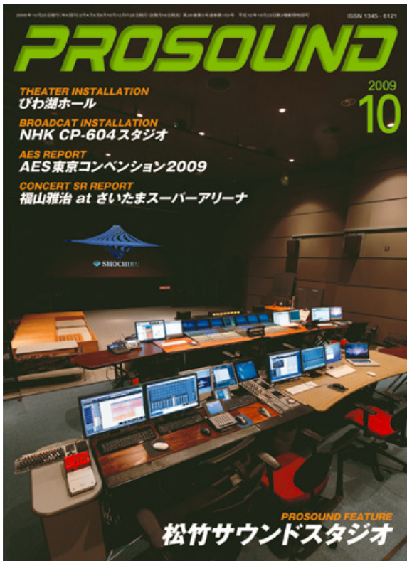
(写真)これが記事のPROSOUNDの表紙です。

専門的な内容で定評のあるPROSOUND誌(発行株式会社ステレオサウンド)の2009年10号のPRIME TALKにOutlineのジョルジオ・ビッフィ社長が掲載されています。(P132~)